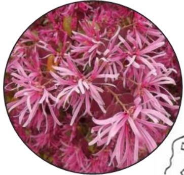
ベニバナトキワマンサク