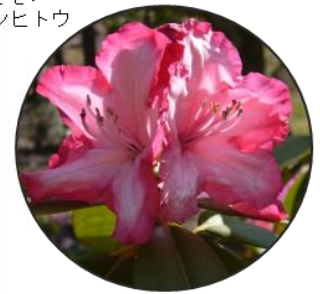
セイヨウシャクナゲ

ソメイヨシノ ツツジ アセビ ドウダンツツジ ユキヤナギ ヒュウガミズキ レンギョウ ハナミズキ ヤマブキ 園内各所