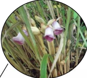
ススキと ナンバンギセル