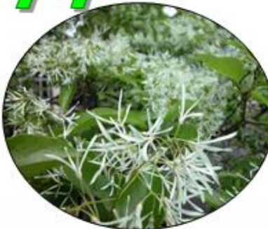
ヒトツバタゴ (ナンジャモンジャ)