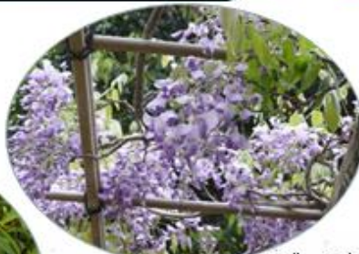
フジ フタリシズカ