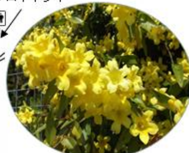
カラライナジャスミン