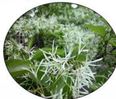
ヒトツバタゴ (ナンジャモンジャ)

ボート利用時間 土・日・祝のみの運行となります。 10:00-12:00 (受付は11:30まで) 13:00-16:00 (受付は15:30まで) 30分 200円 延長は30分まで100円 ※乗船ご利用者が多数の時は早めに受付を終了する事があります。