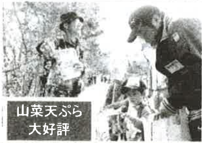
山菜天ぷら 大好評

¥ 500 円 とき 4/7(日) 対象 3歳以上 ただし 小学3年生以下は 保護者同伴 広報 3/15号 定員 60人