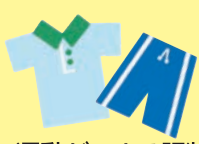
運動ができる服装