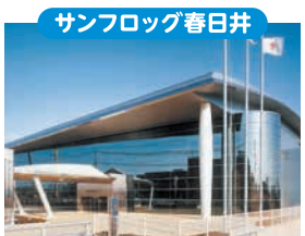
サンフロッグ春日井