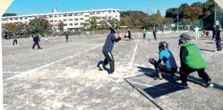
ソフトボール大会