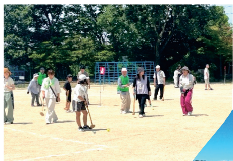
三世代交流 グラウンド・ゴルフ大会

令和5年度には、坂下老人会の女性部より「ボッチャ」の指導を依頼され、坂下公民館で実施しました。コートを2面準備し、参加者を4チームに分け、リーグ戦で行いました。大変好評で本年度は会場を坂下区公会堂に変えて実施しました。今後は、ボッチャだけでなく、他のニュースポーツも紹介していけたらいいなと考えています。