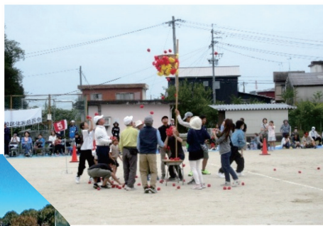
ロクリンピック (秋の運動)